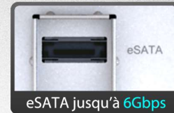
eSATA jusqu'à 6Gbps