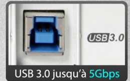
USB 3.0 jusqu'à 5Gbps