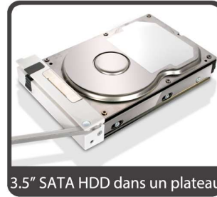
3.5" SATA HDD dans un plateau