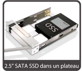
2.5" SATA SSD dans un plateau